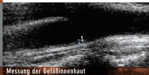
Messung der Gefäßinnenhaut